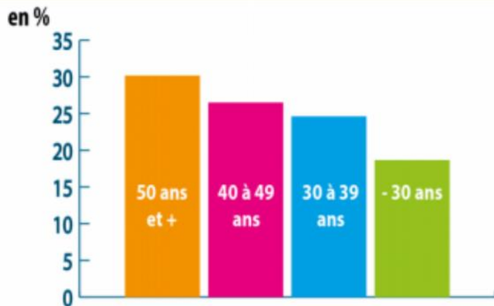
Les emplois dans l'ESS par tranches d'âges dans le département de l'Aube

L'ESS emploie généralement davantage de salarié.e.s de plus de 40 ans que le reste de l'économie. Le département de l'Aube ne fait pas exception à cette règle puisqu'on recense plus de 26% de salariés ayant entre 40 et 49 ans et près de 30% de salariés de plus de 50 ans dans les effectifs ESS.